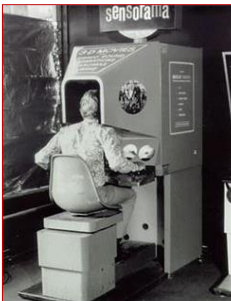
A Sensorama szimulátor