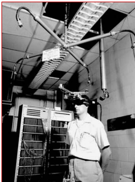
Ivan Sutherland fejre illeszthető kijelzője (1967)