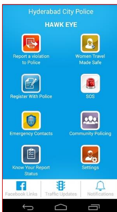
A Hawk Eye képernyőképe